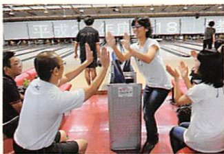
中央ボウリング大会