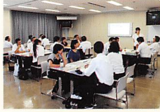
公立小中学校事務職員研修会