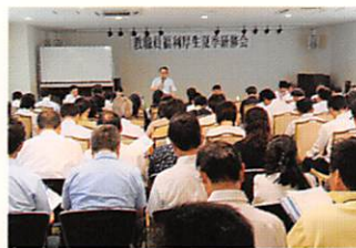
福利厚生夏季研修会