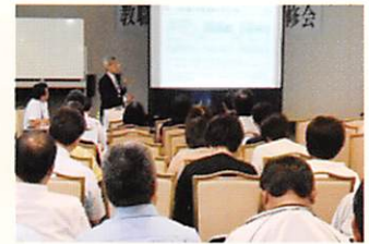
福利厚生夏季研修会(講演)