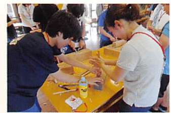
三年目研修会(三年目絆プロジェクト)