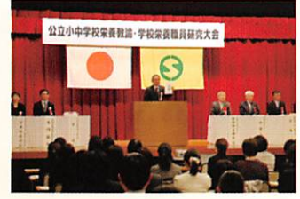
栄養教諭・学校栄養職員研究大会