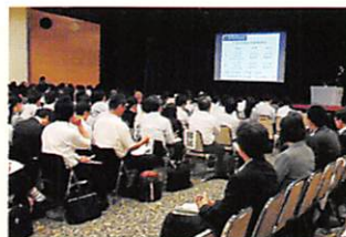
郡市教科等委員長・専門研究委員会