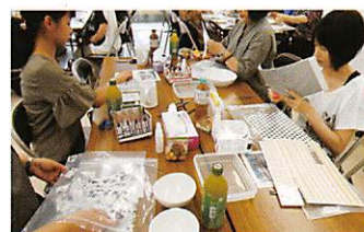
ポーセラーツ教室

壮年部では、毎年夏休みに「ポーセラーツ教室」と「コーヒー教室」を実施しています。のんびりとした夏のひとときをみんなで過ごしています。心も体も豊かで元気になり、2学期以降の活力になっています。