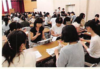
健康教育夏季研修会