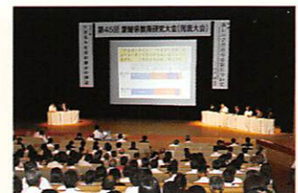
第45回愛媛県教育研究大会