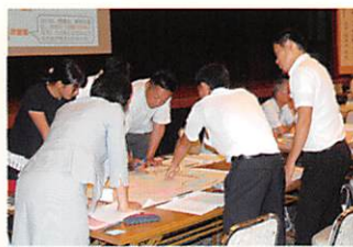
青壮年教職員夏季合同研修会