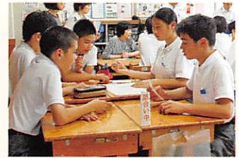
へき地教育研究指定校 要請訪問授業