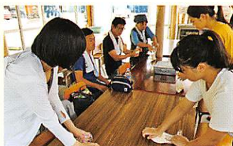
中予 伊予市双海町にて ピザ作り体験