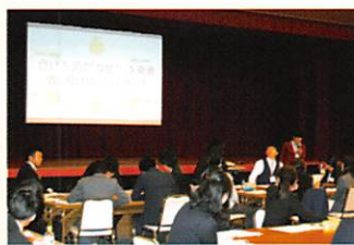
青年教職員研究大会