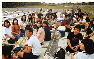
東予 西条市加茂川河川敷にて いもたき