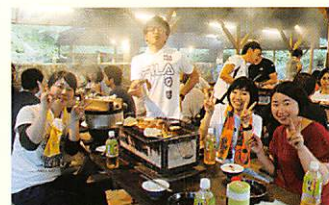
南予 大洲青少年交流の家にて バーベキュー