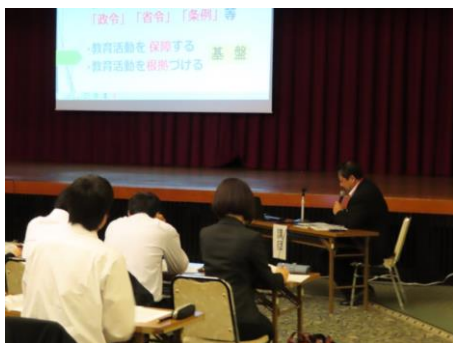
教職教養学習の要点解説