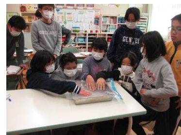
〈写真4 空気の層の実験〉

また、結果をまとめたワークシートをタブレットで撮影し、電子黒板で映し出しながら発表させた。発表用資料を作る時間を省略しながら、分かりやすく発表することができた（写真3）。