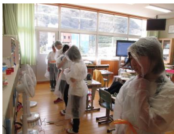
〈写真2 衣服の形の実験〉